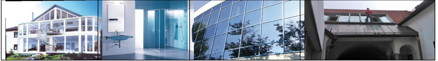
Glasversiegelung eignet sich für Wintergärten, Duschen, Dachfenster und Gewerbebauten und ...

Die Nano-Versiegelung wird noch extra mit einer UV Lampe eingebrannt. Dadurch hält der Schutz länger als alle anderen Produkte. Dank der UV Behandlung schützt die Nano-Beschichtung 3 Jahre und mehr.