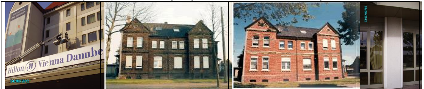
Bild links: Reinigung der Fassade vom Hilton; Mittig Villa vorher und nachher; Bild rechts: Säule – vor und im unteren Bereich nach der Reinigung.

Wir reinigen Fassaden, bessern Fehler aus, Streichen dort wo nötig neu und Sanieren Gesimse. Egal ob Naturstein oder Metall, Klinker oder Kunststein – wir reinigen entweder mit Hochdruck-Dampfreiniger oder mit einem Schon-Sandstrahlergerät und entfernen Ablagerungen wie Ruß und Umweltschmutz, Algen und Moose.