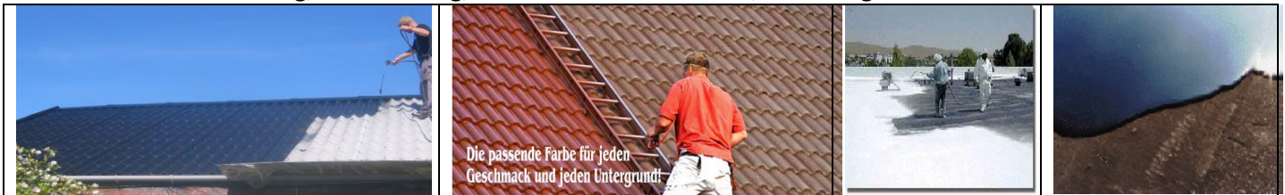
Links: Beschichtung von einem Eternit-Dach; mittig: Ziegeldach-Anstrich; Industriedach in weiß (Sonne-reflektierend) bzw. mit Flüssigfolie abgedichtet

Wir reinigen Dächer, beschichten diese neu mit Farbe und/oder Dichtmaterial und wir sanieren fasernde Eternit-Dächer damit Asbest-Fasern nicht länger in die Luft kommen. Sie sparen die teure Entsorgung als Sondermüll oder gar das Neu-Eindecken. Flachdächer beschichten wir entweder mit einer flüssigen Folie (Bitumen oder Betondächer) oder – mit Farbe. Egal ob Ziegel oder Metaldächer – nur die Art der Farbe ist eine andere. In jedem Fall wird das Dach wie neu und hält garantiert noch weitere 10 Jahre. Wir arbeiten auch mit Klimaschutzfarben.