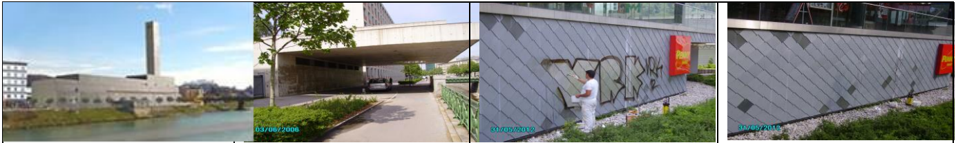
Das Heizwerk in Salzburg, die Noever Terrasse am MAK, zig Schulen, Denkmäler, die Urania, Geschäfte und Wohnhäuser, die TU und andere Unis wurden von uns von Graffiti befreit und gegen neue geschützt.

Wir haben für jede Oberfläche einen optimalen Graffitischutz. Egal ob WDVS wo wir mit einer Graffitischutzfarbe überstreichen) oder Naturstein wo wir farblos und in der Regel unsichtbar und dauerhaft schützen. Egal ob Klinker, Sandstein oder Putz – es gibt für jede Fassade genau eine optimale Lösung. Unser Graffitischutz ist unsichtbar, glänzt nicht und hält lange – wenn Mikrowachs und Konsorten längst abgewaschen sind.