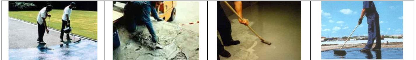
Links: Beschichtung von Gehwegen im Park; Mittig: Ausbessern von Betonböden und Neubeschichtung.

Wir reparieren Löcher in Böden und beschichten diese neu – entweder mit Epoxidharz oder Polyurethan (für Innenbereiche), wir reparieren Betonböden und wir beschichten Asphaltböden und verfüllen Löcher und Risse. Dadurch sind solche Böden im Außenbereich vor Frostschäden geschützt und halten länger. Wir behandeln Estrichböden und machen diese dadurch 5 x so hart wie ohne Behandlung und daher staubfrei. Fällt dann ein Hammer runter ist der Hammer kaputt ;-). Auf Wunsch können wir auch Estriche nachträglich einfärben.